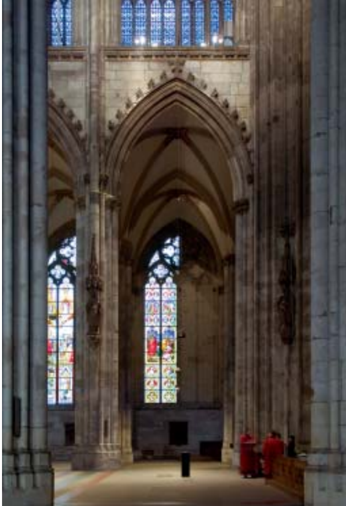
20. Lichtkonzept von Walter Bamberger, Pfünz.