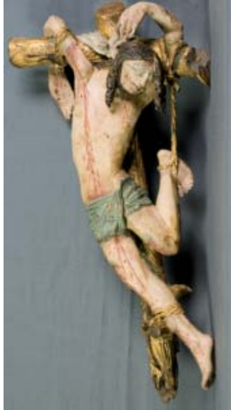
25. Agilolphusaltar, rechter Schächer nach der Restaurierung.