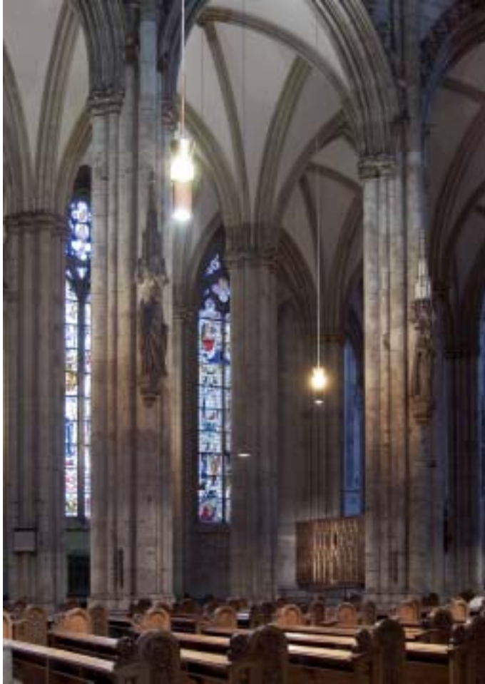
18. Lichtkonzept von Kreuz+Kreuz, Stuttgart.