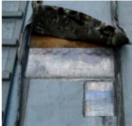
13. Reparatur der Bleibleche an den Seitenschiffdächern der Westseite des Südquerhauses.