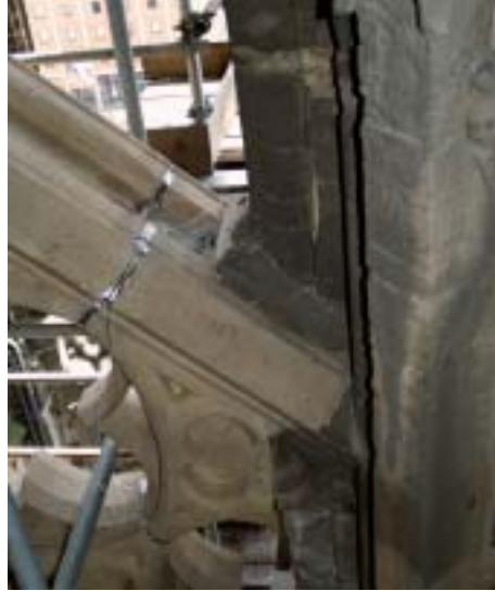
4. Verbindungsstück vom neuen Strebebogen zum vorhandenen Strebepfeiler des Strebewerkes H 8–H 9 der Westseite des Südquerhauses.

chungen notwendig sind, um dieses filigrane Bildhauerstück aus dem härteren, aber beständigeren Material arbeiten zu können.