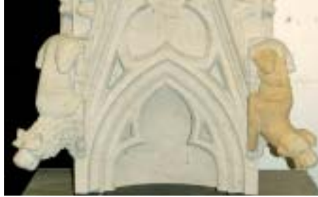
8. Neuer Baldachin für Strebewerk H 8–H 9.

durch die Steinmetzin Monika Müller. Zunächst wurde die Oberfläche mit Hilfe des Mikrostrahlverfahrens gereinigt und eine Schalenbildung am linken Flügel hinterfüllt. Danach wurde die Oberfläche des Engels mit Funcosil KSE 300 HV gefestigt. Der Kieselsäureester wurde mit einer Spritzflasche so lange aufgetragen, bis keine Flüssigkeit mehr aufgenommen wurde. Anschließend wurde naß in naß die Schlämme, die aus demselben Festigungsmaterial bestand, dem Zuschlagstoffe wie Marmormehl zugefügt wurden, mit dem Pinsel aufgetragen. Nach kurzer Wartezeit wurde das überschüssige Material mit einem Schwamm abgerieben, so daß nur eine dünne Schlammschicht die gesamte Oberfläche bedeckte. Dadurch sollte eine zusätzliche Festigung erreicht werden und die Skulptur optisch einheitlich erscheinen. Eine ausführliche Dokumentation wurde erstellt. Bei diesem Engel stellte sich heraus, daß in gewissen Partien noch Leinöl im Stein vorhanden war, was die Festigung natürlich erschwerte. Beim nächsten Engel sollen diese Leinölreste vorher entfernt werden.