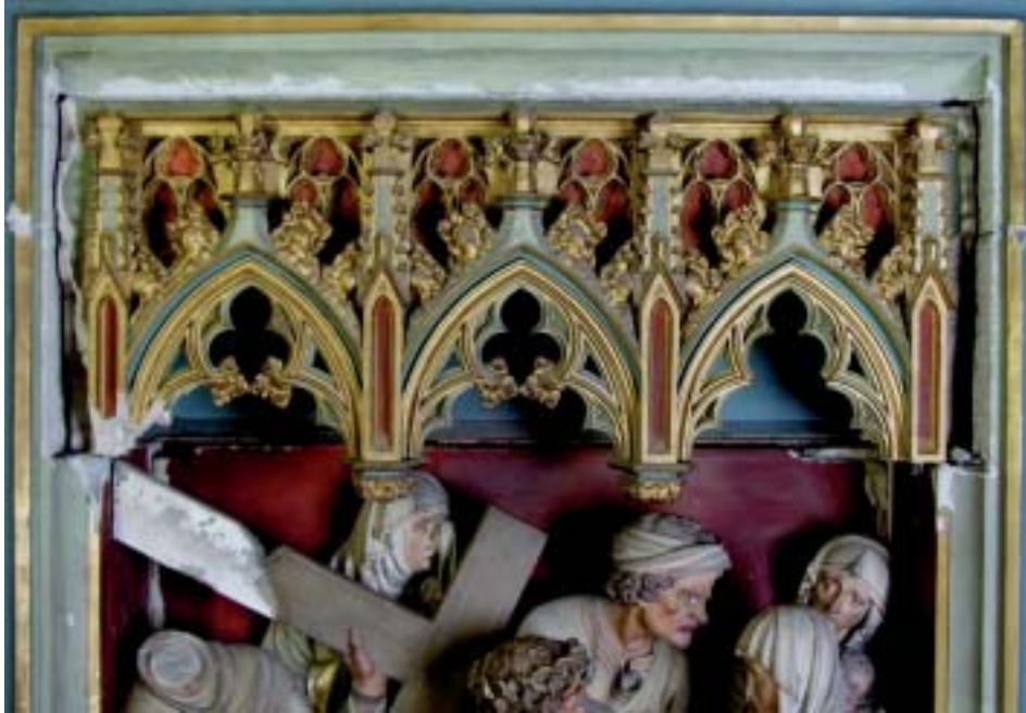
22. Achte Kreuzwegstation vor der Restaurierung.

ließen erkennen, daß man erst nach der Abnahme des Schmutzes und nach vorsichtigen Retuschen die Qualität dieser Reliefs einschätzen kann (Abb. 22, 23).