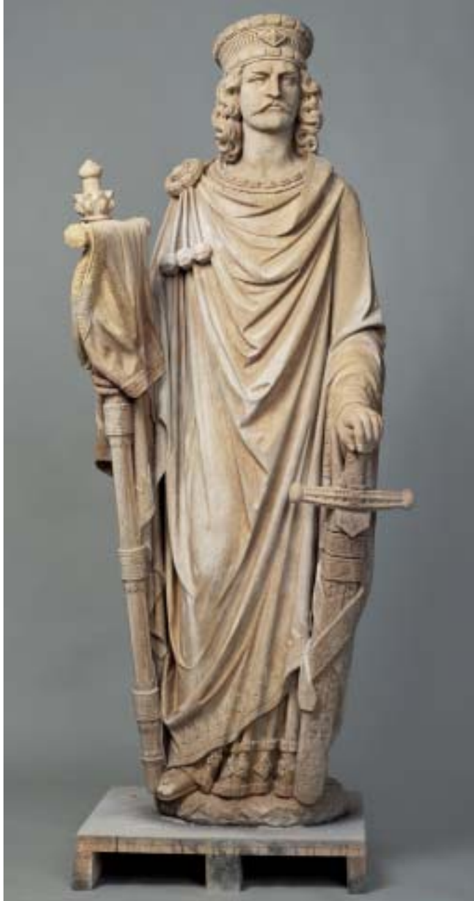
5. Figur des Kaisers Konstantin von Peter Fuchs nach der Reinigung und der Ergänzung fehlender Teile.