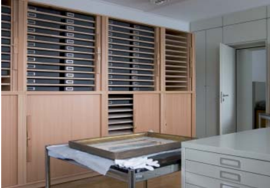
14. Neue Grafikschränke im Archivdepot.

die Sitzgelegenheit wurde verändert, um ein bequemerer Sitzen zu ermöglichen. Nachdem sich dieser Umbau bewährt hat, soll er auch in den anderen Beichtstühlen erfolgen.