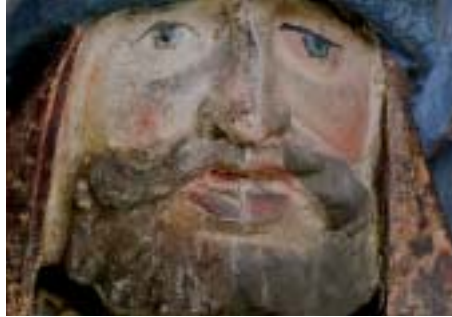
26. Agilolphusaltar, Kopf des berittenen Soldaten aus der Kreuztragung Christi in halb freigelegtem Zustand.

Die Skulptur der hl. Ursula nahe der Vierung im nördlichen Querschiff, die sich in einem sehr guten Zustand befindet, wurde einer trockenen Oberflächenreinigung mit Pinsel und Sauger unterzogen.