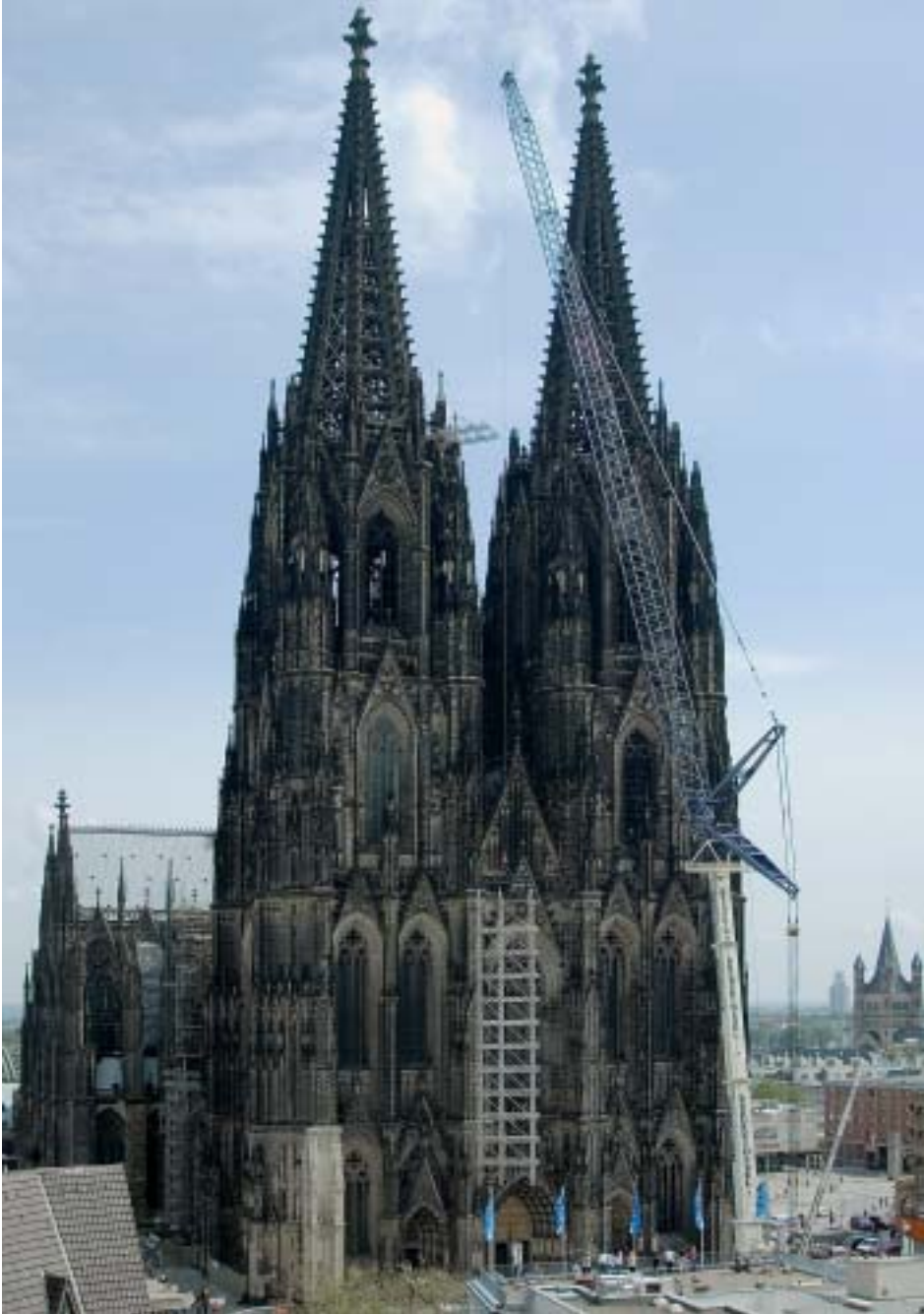
11. Ablassen des Hängegerüsts durch einen Spezialkran am 16. August 2006.