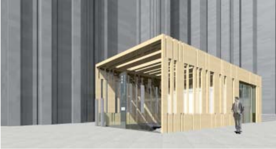
30. Eingangsbauwerk zum Südturm, Entwurfsmodell des Architekturbüros Gatermann+Schossig, Köln.

mes auf die ›List of Danger‹ der UNESCO führte 24 , organisierte Baudezernent Bernd Streitberger im Frühjahr 2006 einen Workshop, zu dem drei Stadtplanungsbüros eingeladen waren.