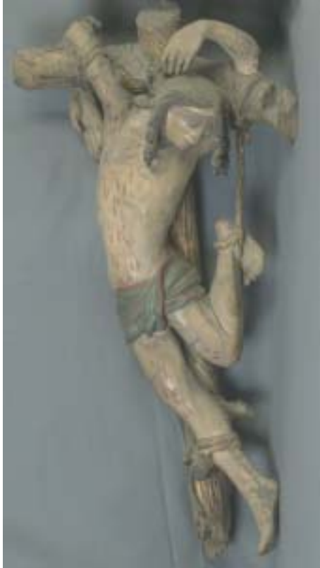
24. Agilolphusaltar, rechter Schächer vor der Restaurierung.