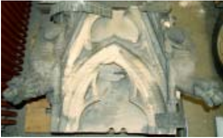
7. Verwitterter Baldachin von Strebewerk H 8–H 9.