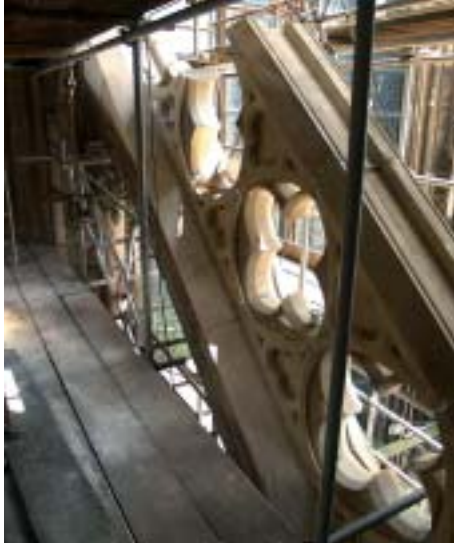
3. Neuer Strebebogen am Strebewerk H 8–H 9 der Westseite des Südquerhauses.