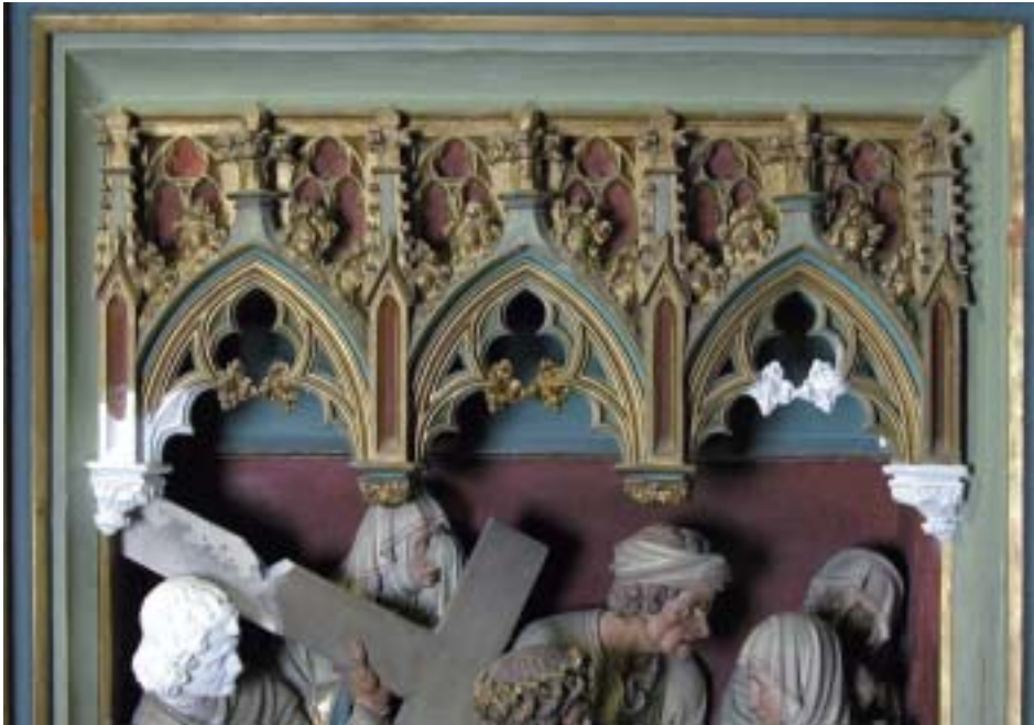
23. Achte Kreuzwegstation nach dem Richten des Baldachins und den plastischen Ergänzungen.