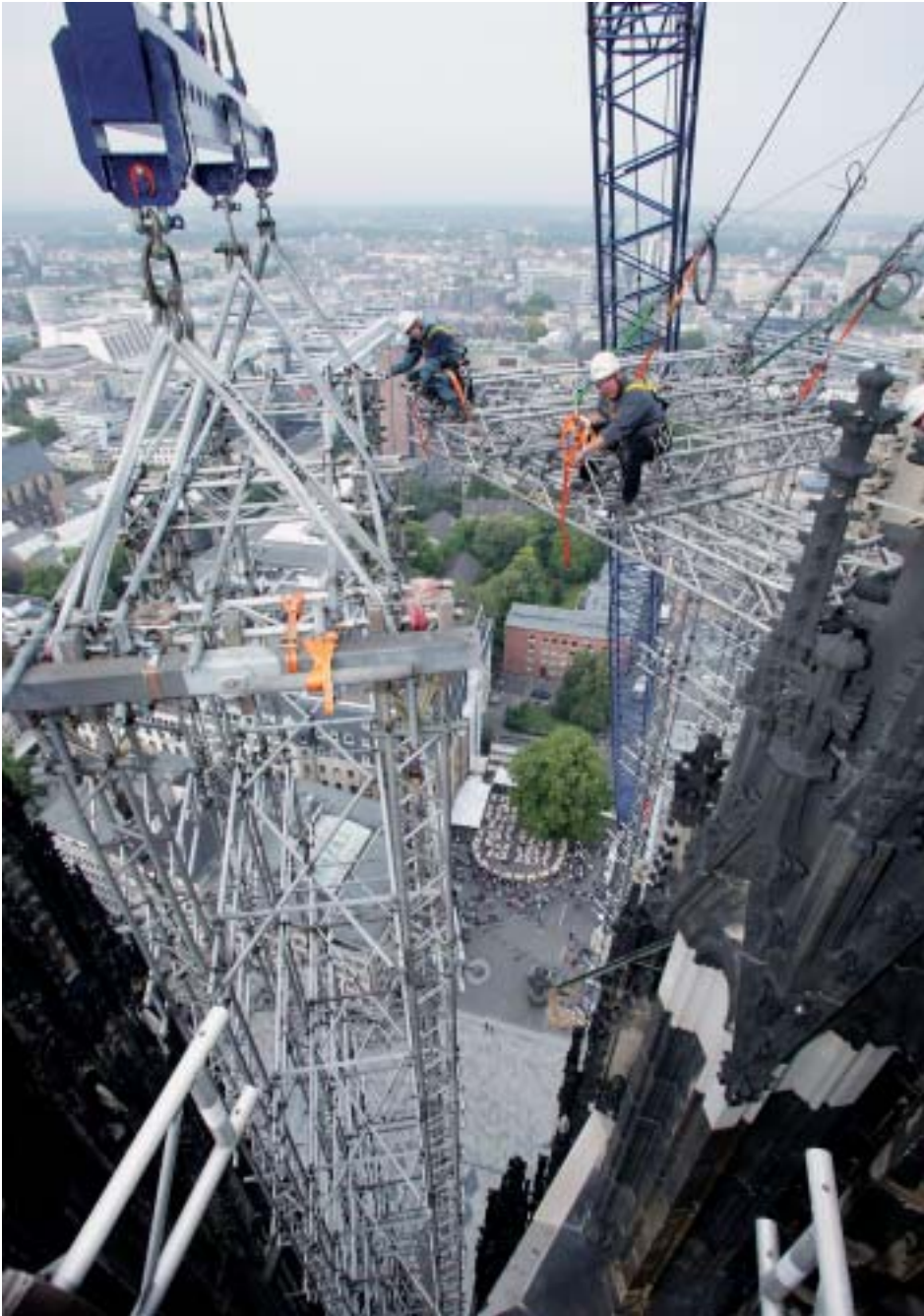
10. Abbau des großen Hängegerüsts vom Nordturm am 16. August 2006.