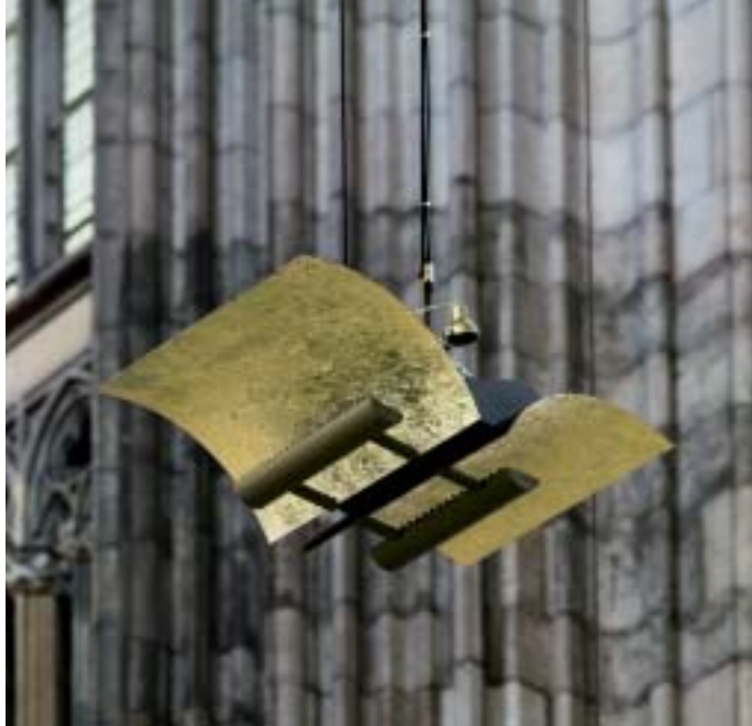
19. Modell für einen Leuchtkörper von Daniel Zerlang-Rösch, Offenbach.

kutiert wurden. Dabei wurde keine der Lösungen als wirklich befriedigend empfunden, dem Konzept von Walter Bamberger aber die beste Entwicklungsmöglichkeit zugestanden. Deshalb wurde dieser mit der Neubeleuchtung des Domes beauftragt. Eine verfeinerte Lösung mit einer veränderten Beleuchtung der Seitenschiffe – die dort zuerst vorgesehene Beleuchtung aus den Schlußsteinen wurde als zu ›neugotisch‹ empfunden – wurde zusammen mit einem Vorschlag für eine Vierungsbeleuchtung dem Domkapitel am 20. Juli vorgestellt. Das Langhauskonzept wurde akzeptiert, die Vierungsbeleuchtung aber abgelehnt. Herr Bamberger wird nun versuchen, auch die Vierung mit Strahlern an der Triforiumsebene zu beleuchten. Diese Lösung und sein Vorschlag für die Chorkapellenbeleuchtung wird am 13. November vorgestellt werden. (Abb. 18–20).