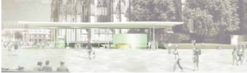
29. Eingangsbauwerk zum Südturm, Entwurfsmodell des Architekturbüros van den Valentyn, Köln.