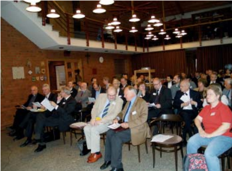
27. Teilnehmer des Grabungskolloquiums in der Dombauhütte.

gesamt sind das Kolloquium und die präsentierten Ergebnisse trotz vorhandener kontroverser Meinungen sehr positiv aufgenommen worden. Im nächsten Berichtszeitraum soll das Manuskript druckfertig gemacht werden. Dafür sind vor allem noch zahlreiche Zeichnungen zu fertigen (Abb. 27).