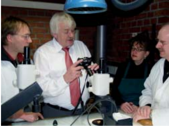
17. Erläuterung der von der Firma Leica geschenkten Stereomikroskope in der Glasrestaurierungswerkstatt des Domes.

glasung der Südquerhausfassade gestiftet hatte – im Jahr 1948 die Verglasung des Obergadens und 1959 die Fenster der Triforiumszone. Die Triforiumsfenster, die künstlerisch anspruchsvoller gestaltet sind als die farblosen Scheiben des Obergadens, wurden zunächst sorgfältig ausgebaut. Sie werden gereinigt, instandgesetzt und fotografisch dokumentiert. Ob die Scheiben dann komplett archiviert werden oder – was die zuständigen Vertreter der Kölner Kreishandwerkerschaft erwägen – eine neue Bestimmung erhalten, ist zur Zeit noch offen.