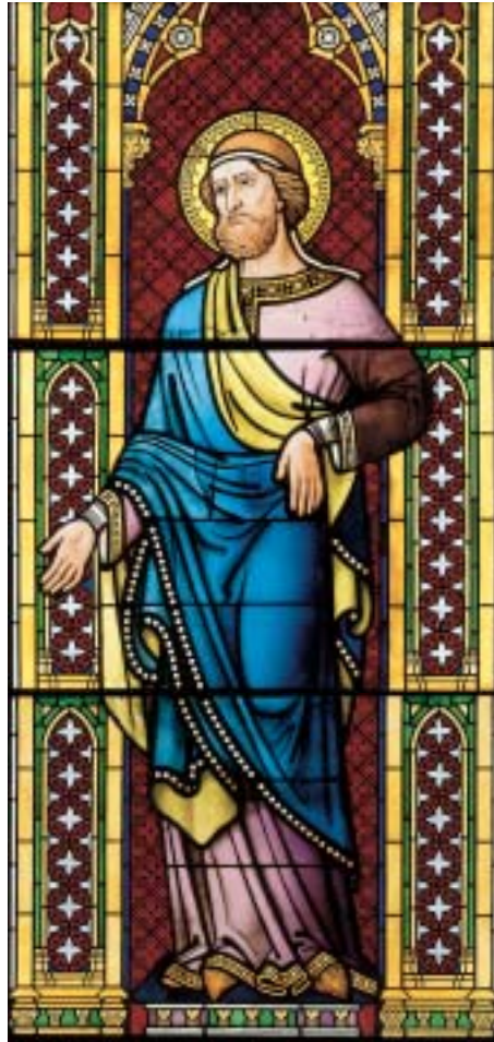
16. Figur des Jakob aus dem Abrahamfenster von Michael Welter im Nordquerhaus des Domes nach der Restaurierung.

Für die Vorlagenkartons wurde im neuen Archivdepot der Dombauverwaltung ein Raum eingerichtet, den die Domschreinerei mit passenden Schubladenschränken ausstattete. Dort sollen die Kartons zukünftig liegend aufbewahrt werden. Allerdings setzt das die Trennung der meterlangen Bahnen in kleinere Segmente voraus und zugleich müssen alle Bahnen gereinigt und gefestigt werden. Diese Arbeit wird sukzessive durch Papierrestauratoren erfolgen.