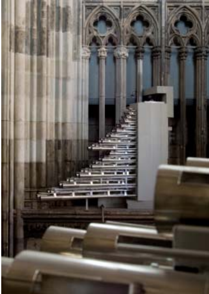
21. Spanische Trompeten im Westjoch des Langhauses.

starke Schmutzschichten abgelagert, die vom Regenwasser, das durch die zerstörten Fenster eindrang, eingebunden wurden.