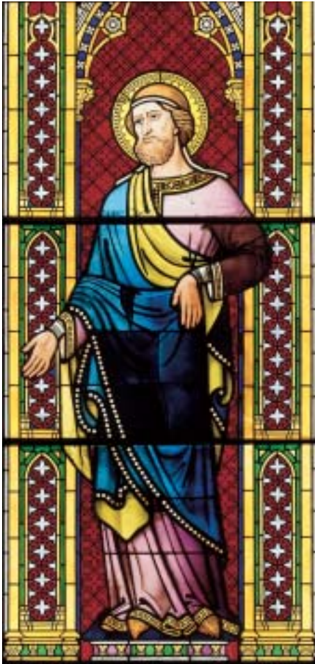
15. Figur des Jakob aus dem Abrahamfenster von Michael Welter im Nordquerhaus des Domes vor der Restaurierung.