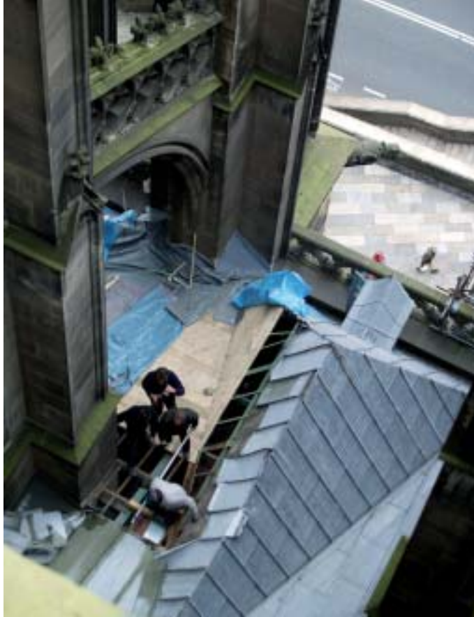
12. Erneuerung der Bleideckung am Nordseitenschiff.

Dafür spiegelten sich aber Temperaturschwankungen in den Ankerkräften sehr deutlich wider und ließen sie zwischen 6 und 9 t schwanken. Dieser Effekt wird wohl nicht durch Längenänderungen der Anker selbst verursacht, sondern durch die Wärmedehnung der Südquerhausfassade in der Mittagssonne.