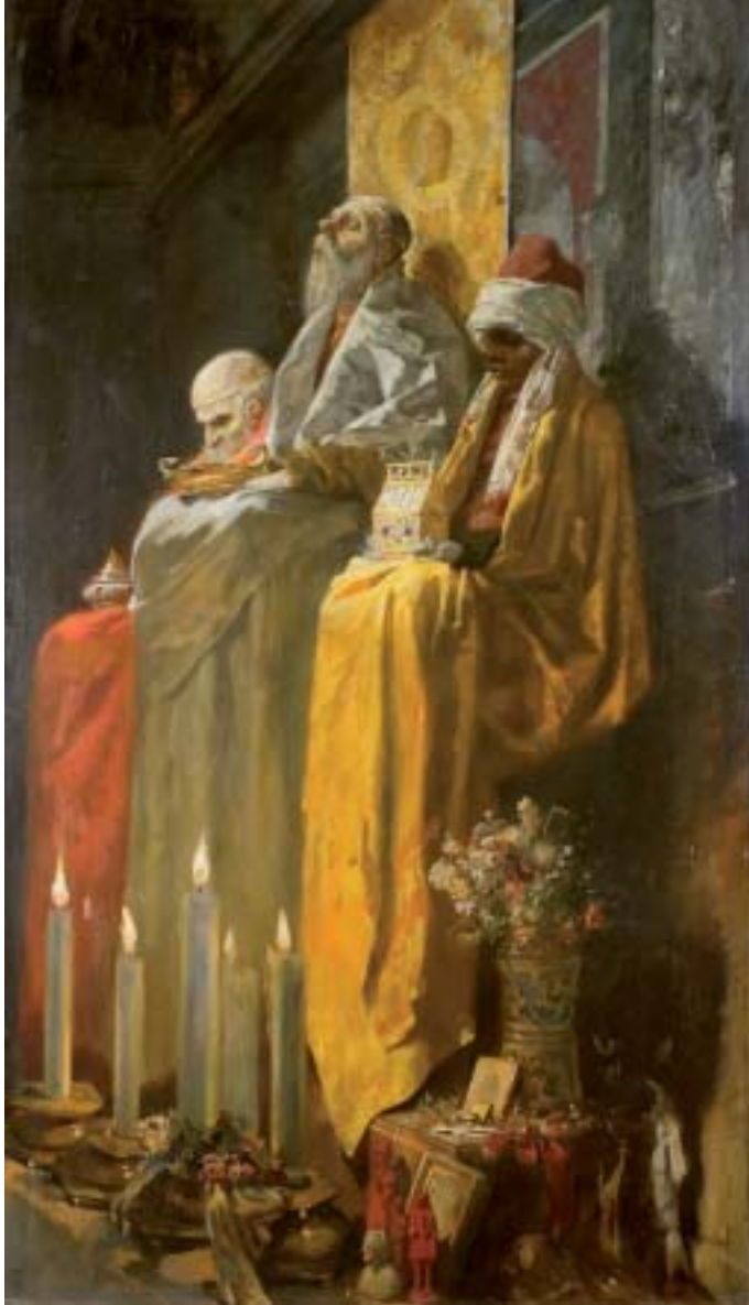
31. Dreikönigsbild von Guy de Maillart, um 1900. Köln, Dombauarchiv.

trum für Umweltkommunikation der Deutschen Bundesstiftung Umwelt (DBU) in Osnabrück am 2. und 3. Mai über den Lebensraum Dom; auf der Tagung der »european association of building crafts and design« in Laas, Südtirol, am 7. Juli