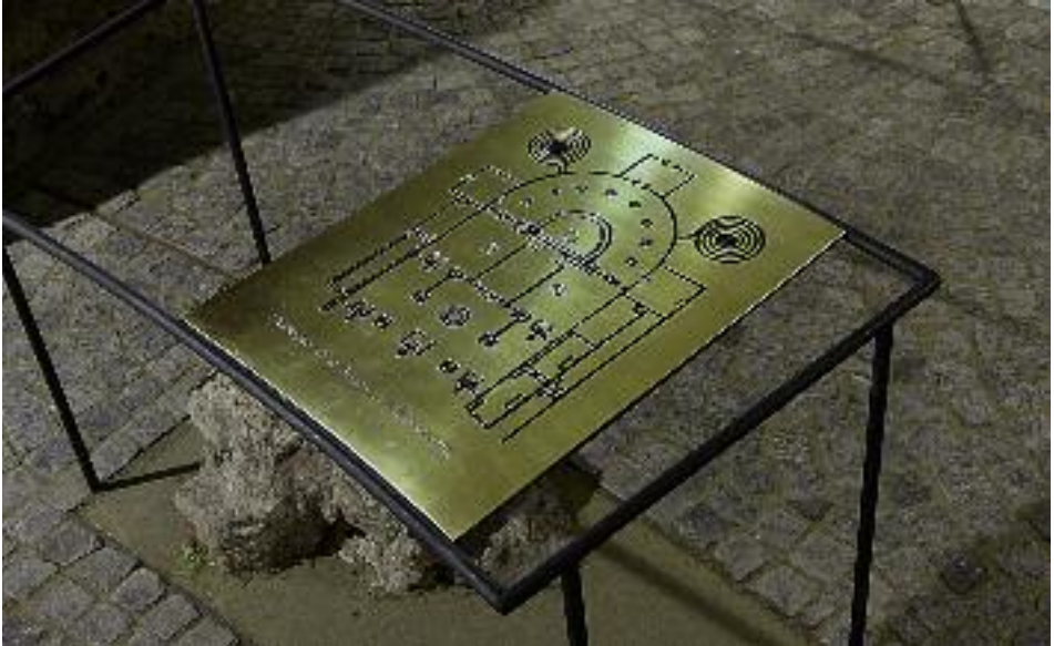
21. Messingtafel mit eingezttem Grundriss des St. Galler Chorungangs.

terten Stellen eine Konstruktion entwickelt, die verhindert, dass das Wasser hinter die Wetterschenkel der kleinen Fensteröffnungen in den Türen laufen kann (Abb. 22).