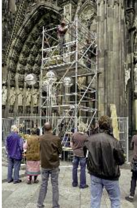
18. Bau eines Gerüstes für das Versetzen der restaurierten Statuen an der Westfassade.