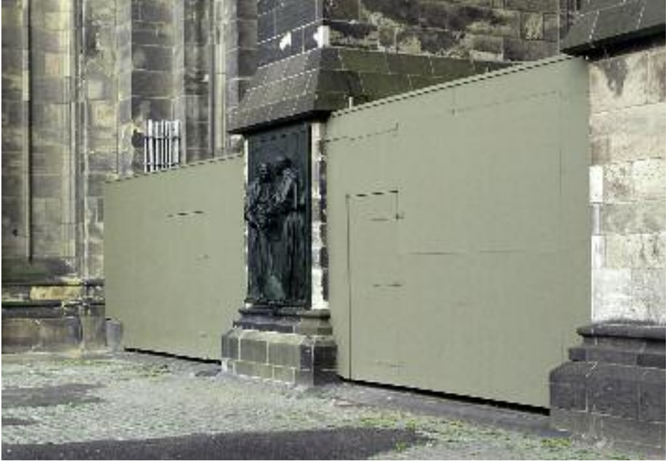
19. Hölzerne Bauzäune an der Langhaussüdseite.