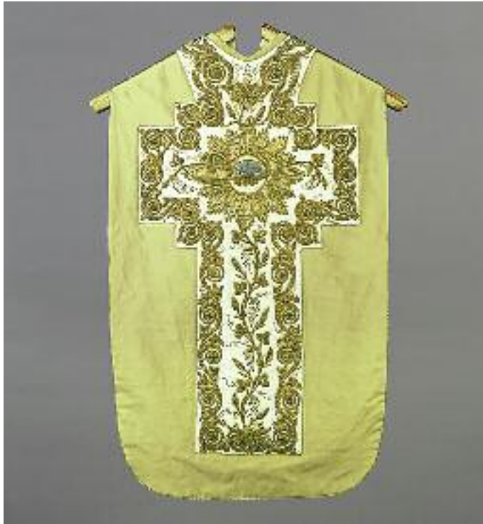
35. Kasel der weißen Kapelle nach der Restaurierung.