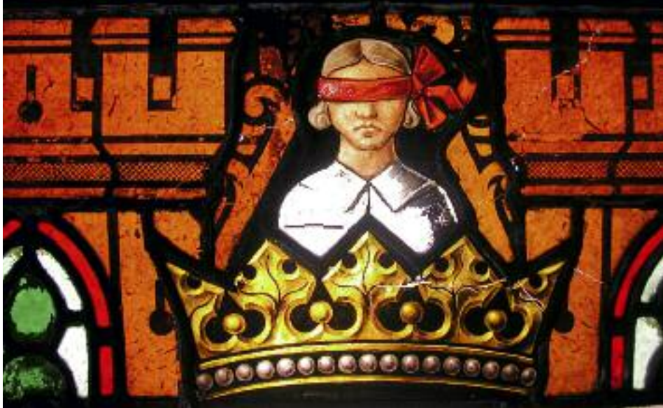
27. Ausschnitt aus der Wappenzeile des ›Jesus-Sirach-Fensters‹. Die orange-braunen Gläser sind kleinteilig zerrissen.

2.8 Neues Forschungsprojekt der Deutschen Bundesstiftung Umwelt (DBU) Die Deutsche Bundesstiftung Umwelt, Osnabrück, fördert ein neues Forschungsvorhaben mit dem Titel »Anwendungen innovativer Restaurierungsmaterialien und -methoden zur Sicherung craquelierter Glasmalereien«. Gegenstand der Untersuchungen ist ein spezielles Schadensproblem, das kleinteilige Zerreißen von historischen Gläsern, das sich in unterschiedlichen Rissmustern von oberflächlichen Haarrissen bis zu ausgeprägten Tiefenrissen ausbilden kann. Dieses Schadensbild tritt überwiegend an gelb-braunen Gläsern des 19. Jahrhunderts auf. Auch Fenster des Domes sind davon betroffen, zum einen das große Westportalfenster, zum anderen das ›Jesus-Sirach-Fenster‹ aus dem Welter-Zyklus (Abb. 27). Zur konservatorischen Behandlung von kleinteilig zerrissenen Gläsern gibt es derzeit kein adäquates Verfahren. Wünschenswert wäre die Möglichkeit, Festigungsmaterialien in die craquelierten Gläser einzubringen. Die üblichen zur Verfügung stehenden Mittel sind jedoch nicht geeignet, da sie nicht hinreichend in die Risse eindringen. Daher sollen neue, speziell auf die Struktur und Rissmuster craquelierter Gläser abgestimmte Festigungsmittel aus hydroaktiven Gelen entwickelt werden. Auch sollen zusätzliche Stabilisierungsmaßnahmen wie die Applikation von Glasfasergeweben in Kombination mit dünn aufgetragenen