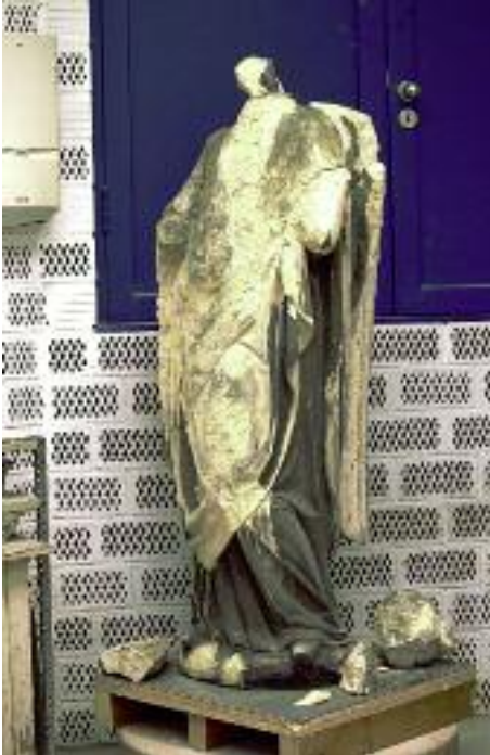
15. Stark verwitterter Engel von der Südquerhausfassade des Kölner Domes nach dem Abbau.