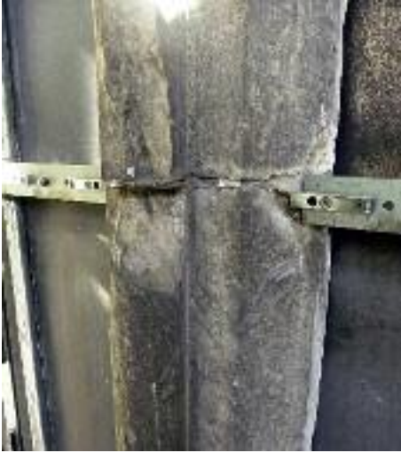
3. Beschädigtes Maßwerk im westlichen Chorobergadenfenster der Südseite.