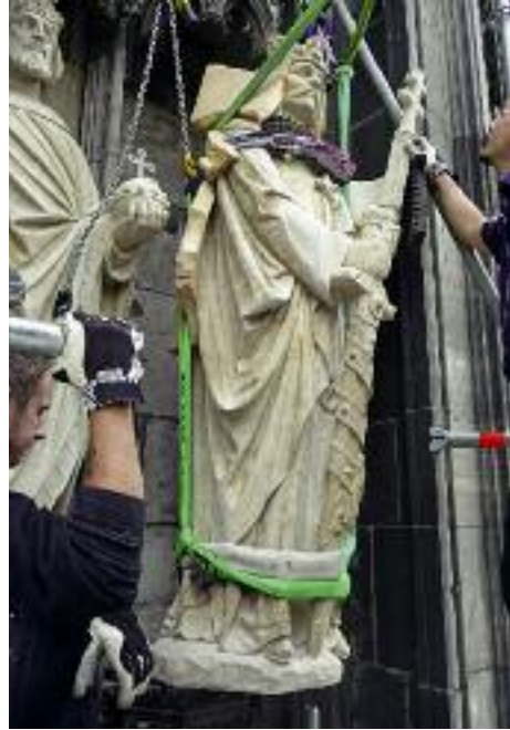
6. Aufstellen der Statue des hl. Stephan von Ungarn an der Westfassade.