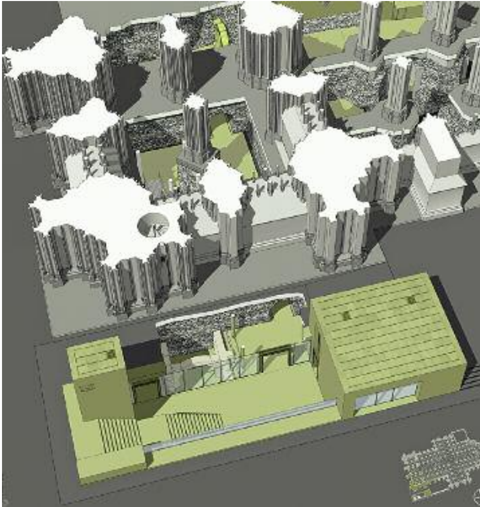
34. Südturmfundament und neues Eingangsgebäude zur Turmbesteigung, Isometrie.

punkte verdichtet. Fehlende Informationen, wie zum Beispiel Laufwege, Bodenbeläge und Höhenkoten, konnten nun in einem nächsten Schritt in relevanten Bereichen ergänzt und für die Umbauplanung und Neugestaltung genutzt werden.