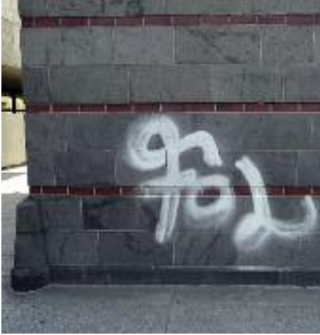
24. Graffiti an der Außenwand der Dombauhütte.

te, hat Schreinermeister Norbert Klewinghaus diesen mit einer flachen Holzpyramide abgedeckt.