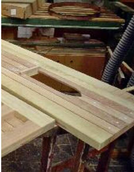
22. Neue Türen für die Eingänge zum Triforium auf der Werkbank.