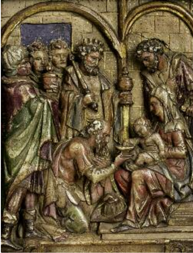
40. Van Eeghem, Anbetung der Hll. Drei Könige, farbig gefasstes Alabasterrelief.

Für den Ausstellungskatalog »Aufbruch in die Gotik. Der Magdeburger Dom und die späte Stauferzeit« verfasste sie einen Aufsatz und verschiedene Katalognummern. 53