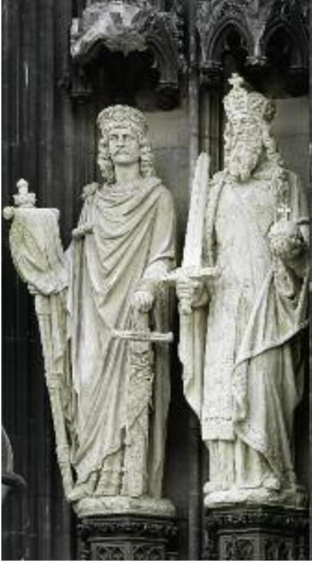
7. Die Statuen Konstantins und Karls des Großen nach dem Einbau an der Westfassade.