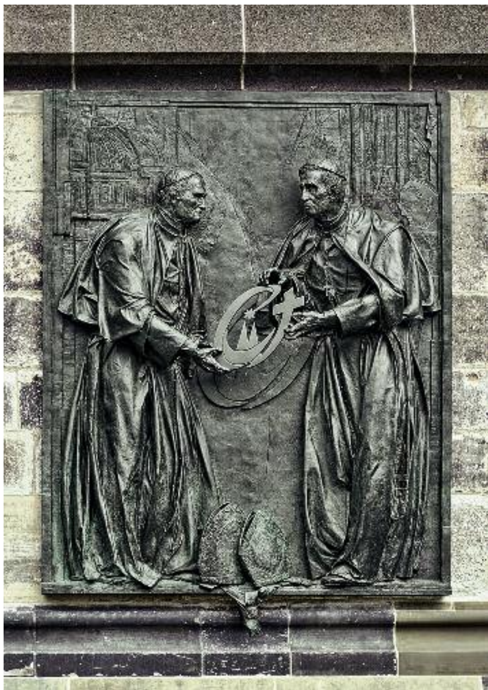
29. Bert Gerresheim, Gedenktafel für den XX. Weltjugendtag im August 2005 in Köln.