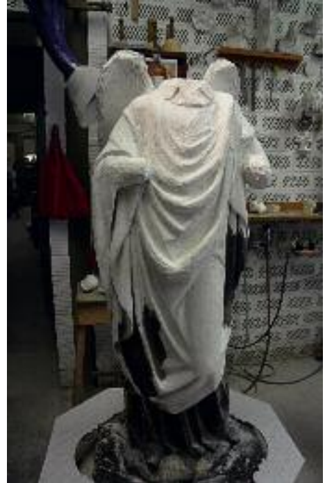
16. Verwitterter Engel von der Südquerhausfassade mit Gipsergänzungen am Gewand.

genutzten Petersportal stehen, soll nun genau geprüft werden, ob es aus Sicherheitsgründen notwendig ist, alle stark beschädigten Figuren abzunehmen.