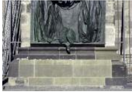
12. Sockel des Strebe Pfeilers A 4 an der Langhaussüdseite nach der Restaurierung.

nem originalen Aufstellungsort. 9 Neuerliche Untersuchungen der Steine machten Änderungen gegenüber der ursprünglichen Rekonstruktion von Dr. Dorothea Hochkirchen von 1996 notwendig.