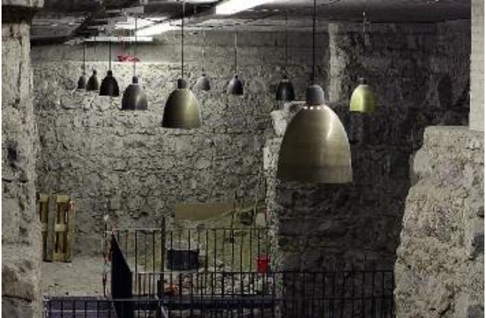
25. Wiederverwendete Kupferlampen aus dem Dominnenraum in der Domgrabung.

tung der westlichen Bereiche der Domgrabung. Die Kästen mit den Steuerungen der Windfänge und die Datenleitung des Domes mussten verlegt werden. Ein neuer Elektroschrank wurde an einer nicht einsehbaren Stelle aufgebaut. Der Lichtdesigner Daniel Zerlang-Rösch hat zusammen mit Bernd Billecke eine neue Beleuchtung für den Bereich der Ausgrabung entwickelt. Entlang des Fundamentes wurden wie in den Durchbrüchen lineare Leuchten angebracht. Die grellen Neonbänder wurden abgebaut und stattdessen Einzelleuchten installiert, die über Dimmer steuerbar sind. Von Daniel Zerlang-Rösch stammt der Vorschlag, dass für diese Leuchten die im Dominnenraum abgebauten Kupferleuchten sehr geeignet wären. Von einem ersten Versuch waren alle begeistert, so dass jetzt diese Lampen für die Grabungsbeleuchtung eingesetzt werden (Abb. 25). Ein ebenso praktischer wie preiswerter Umbau!