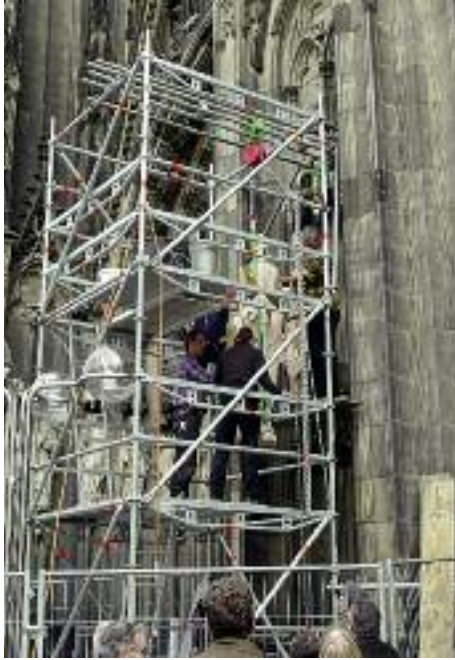
5. Hochziehen der restaurierten Statue des hl. Stephan von Ungarn im Gerüst.