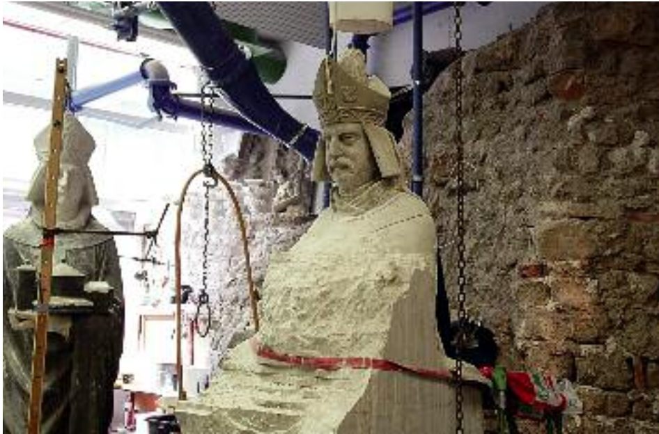
9. In Teilen ausgearbeitete Statue des hl. Heribert vom Maternusportal der Nordquerhausfassade.

eine Kopie zu ersetzen. Kopf und Attribute werden dabei wieder den historistischen Formen des 19. Jahrhunderts nachempfunden. Bildhauer Michael Oster hat Ende 2008 begonnen den originalen Rumpf der Figur mit Gips zu ergänzen. Dieser dient als Modell für die Ausführung der Kopie in Obernkirchener Sandstein. Mit der Ausarbeitung der Figur wurde begonnen (Abb. 9).