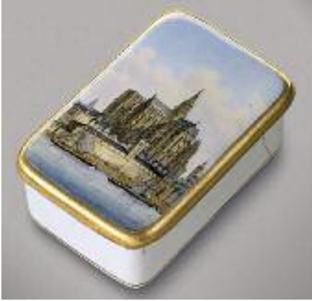
38. Streichholzdose der Manufaktur KPM mit Dommotiv.