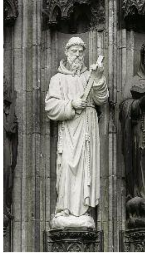
8. Erneuerte Statue des hl. Franziskus im Michaelsportal der Nordquerhausfassade.