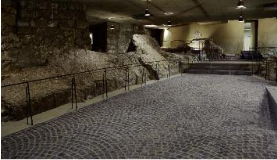
33. Neugestalteter Grabungsbereich vor der karolingischen Westapsis.