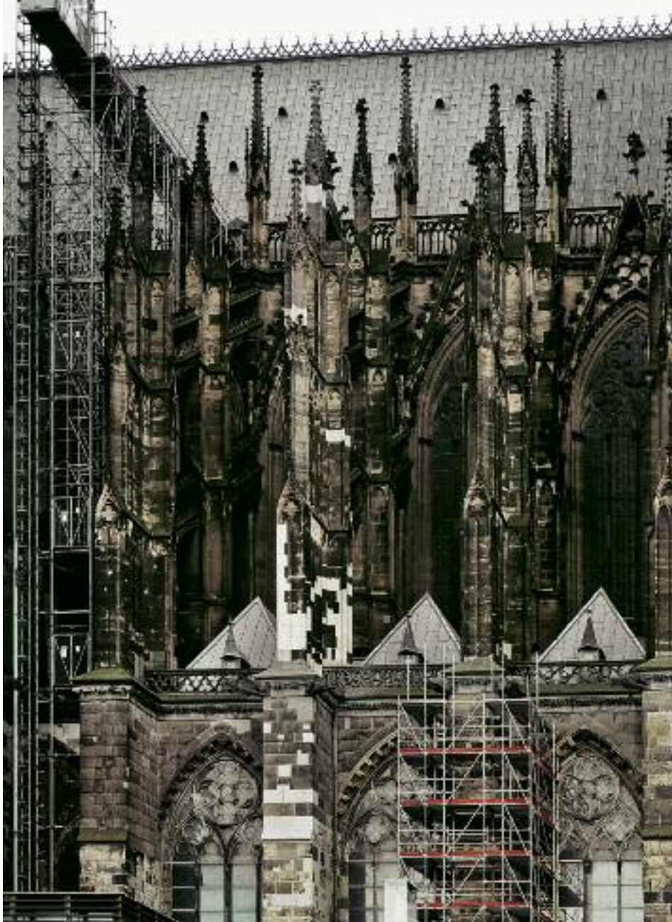
2. Langhaus Nordseite mit Strebepeiler F 5 nach abgeschlossener Restaurierung und Strebepeiler F 6 während der Einrüstung.