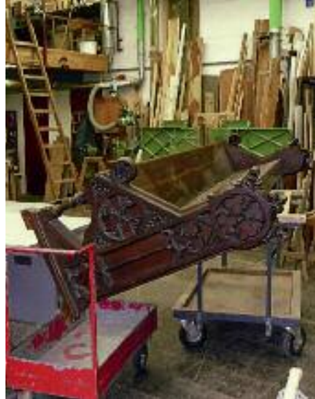
23. Kirchenbank aus der Kreuzkapelle in der Schreinerwerkstatt.

1.6.4 Regale für Lagerräume im neuen Eingangsgebäude zur Turmbesteigung Für zwei Nebenräume unter der Treppe des neuen Eingangsgebäudes wurden Regale errichtet. Der eine Raum dient als neues Lager für den Verlag Kölner Dom, der zweite als Stauraum für die Gerätschaften, die zur Reinigung des neuen Gebäudes benötigt werden.