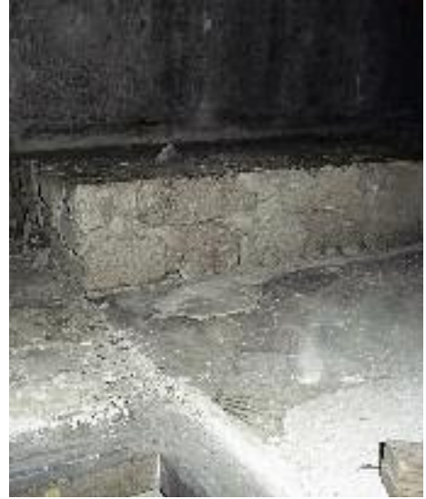
14. Bimssteinsockel unter dem Agilolphusaltar während des Abbruchs.