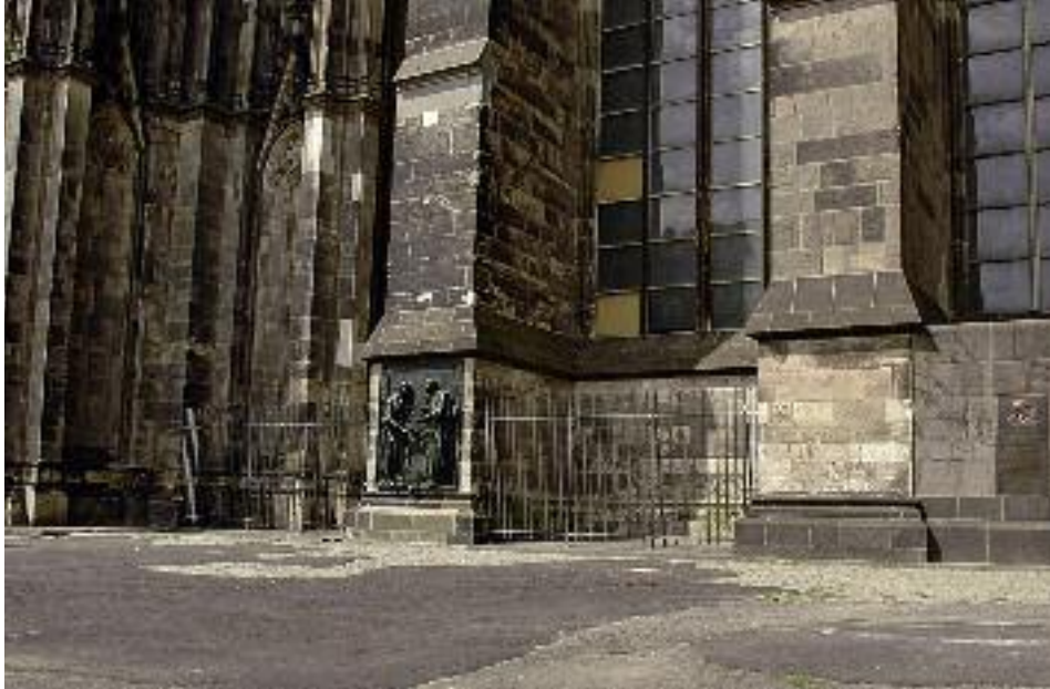
20. Neue Gitter an der Langhaussüdseite.