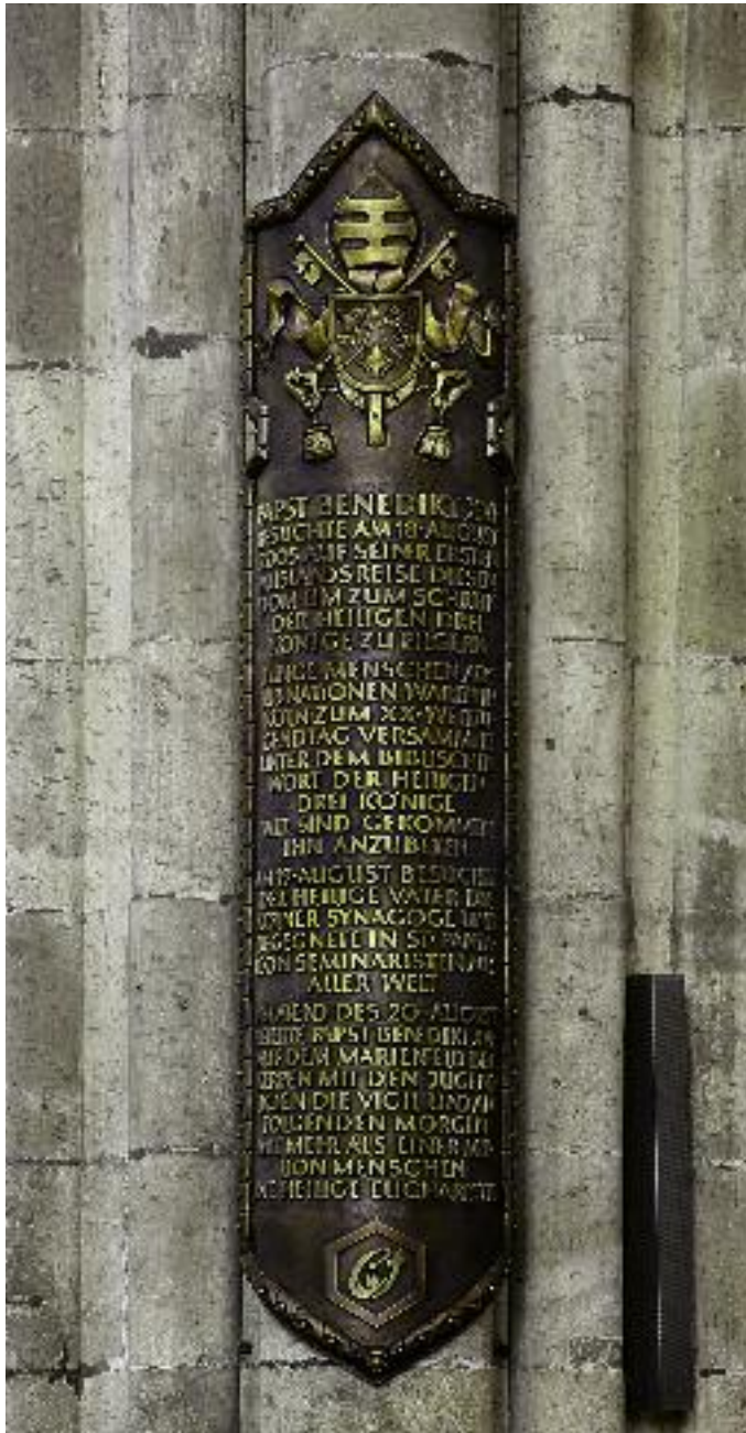
31. Heribert Calleen, Gedenktafel für den Besuch Papst Benedikts XVI. im Kölner Dom am 18. August 2005.