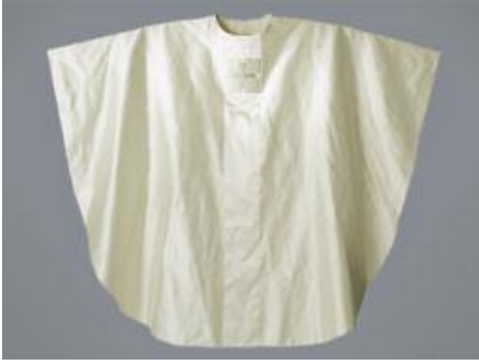
36. Neu angeschaffte weiße Kasel nach dem Entwurf von Schmitt-Paramente/Polykarp-Reuss.

Grundgewebes aus den 1960er Jahren wurde für die neuen Gewänder eine goldfarbene Seide und ein gelbes Baumwollfutter gewählt. Zur Vermeidung von Faltenbildungen sind Vorder- und Rückseite der Kaseln mit einer Rosshaareinlage ausstaffiert worden. Nach Abschluss der Arbeiten im September 2009 stehen dem Dom nun wieder vier festliche Kaseln mit Goldstickerei samt Zubehör für die Messen an den Hochfesttagen zur Verfügung. Die zuvor angefertigte Musterkasel wurde mit vorhandenen Goldborten besetzt, so dass sie bei Konzelebrationen nun als fünfte Kasel verwendet werden kann (Abb. 35). 43