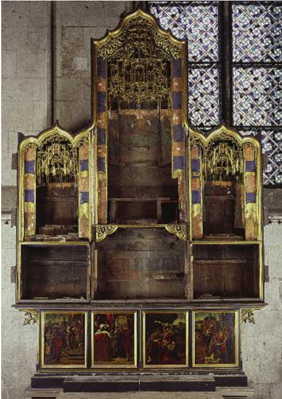
32. Altarschrein des Agilolphusaltars ohne Figuren.