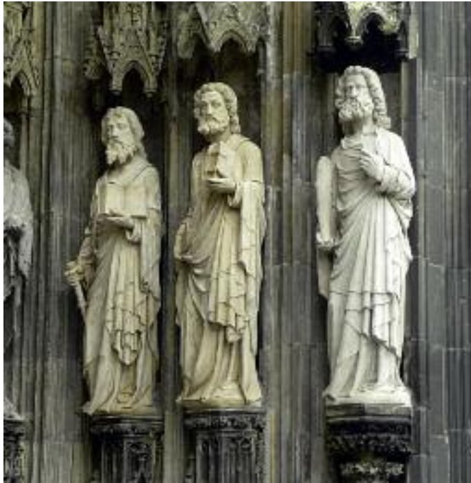
17. Statuen der Apostel Philippus (links) und Bartholomäus (Mitte) im südlichen Gewände des Petersportales nach der Laserreinigung.