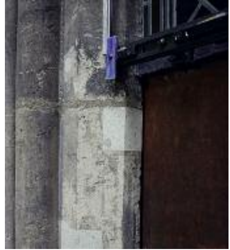
4. Mit einer Vierung versehenes Maßwerk im westlichen Chorobergadenfenster der Südseite.