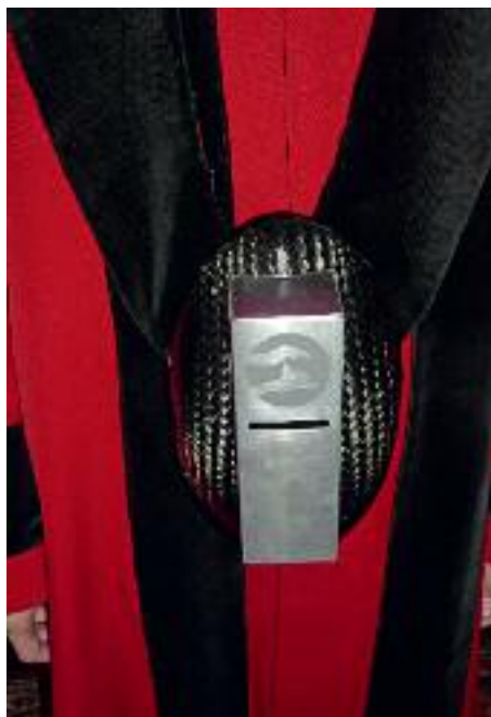
37. Prototyp für neue Spendenbox der Domschweizer.

ganze Reihe weiterer Themen, mit denen der Kölner Dom im Berichtszeitraum in der Presse präsent war. So wurde im November und Dezember 2008 über die Veröffentlichung von gleich drei neuen Büchern zum Kölner Dom berichtet: der neue Grabungsband zum gotischen Dom, die Forschungsarbeit zur Domfreilegung im 19. Jahrhundert und das Kölner Domblatt 2008.