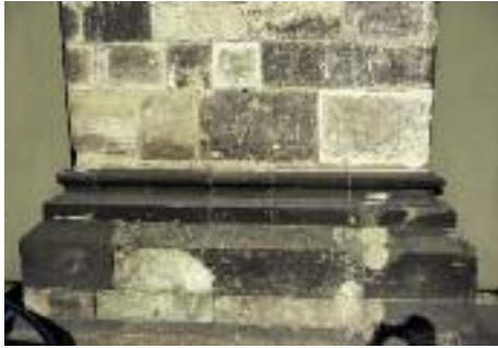
11. Sockel des Strebe Pfeilers A 4 an der Langhaussüdseite vor der Restaurierung.